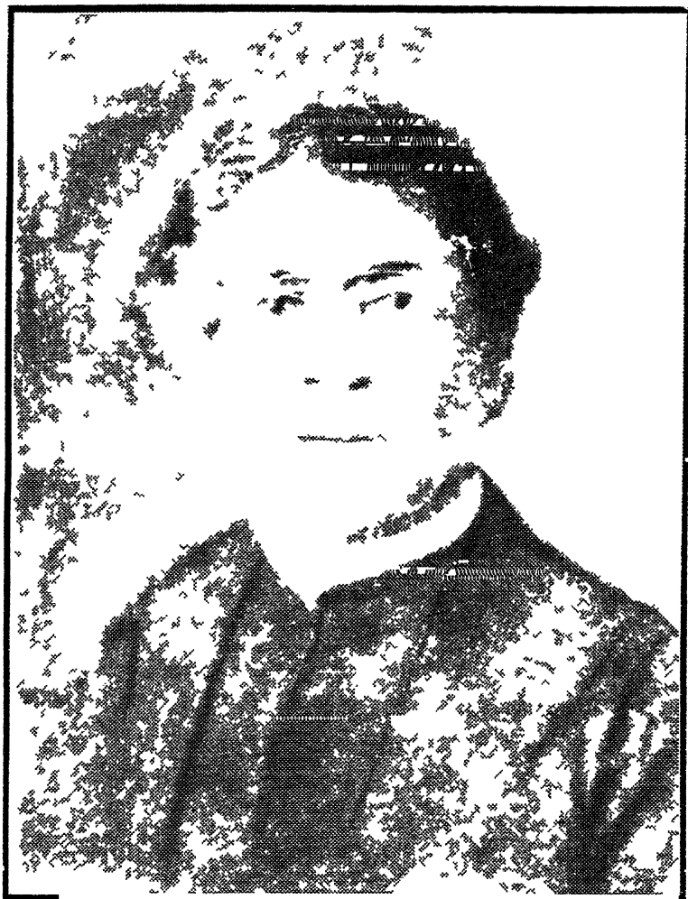
विज्ञानाचार्य सर जगदीशचन्द्र बोस